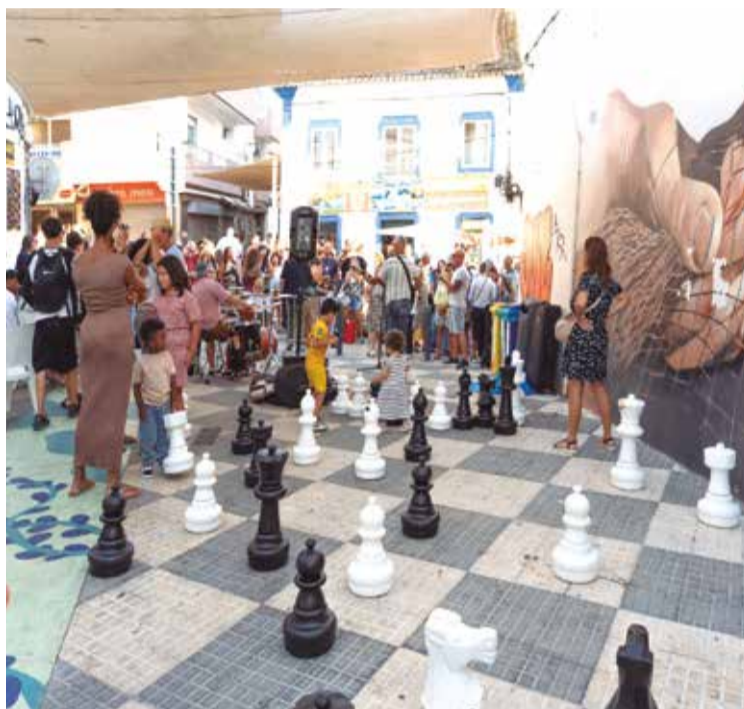
DR. Animação para todas as idades é ponto forte do festival

Com entrada livre, o 'InDireita Street Fest' volta a dinamizar