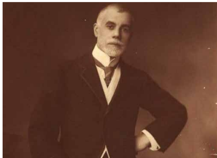
Portimão recorda nascimento do seu mais ilustre cidadão

"Nestes dias estranhos, em que a diplomacia global parece votada ao insucesso, começa a instalar-se, um pouco por todo o lado, o sentimento de que podemos não estar longe de um confronto de larga dimensão. Em 1914, Manuel Teixeira Gomes es-