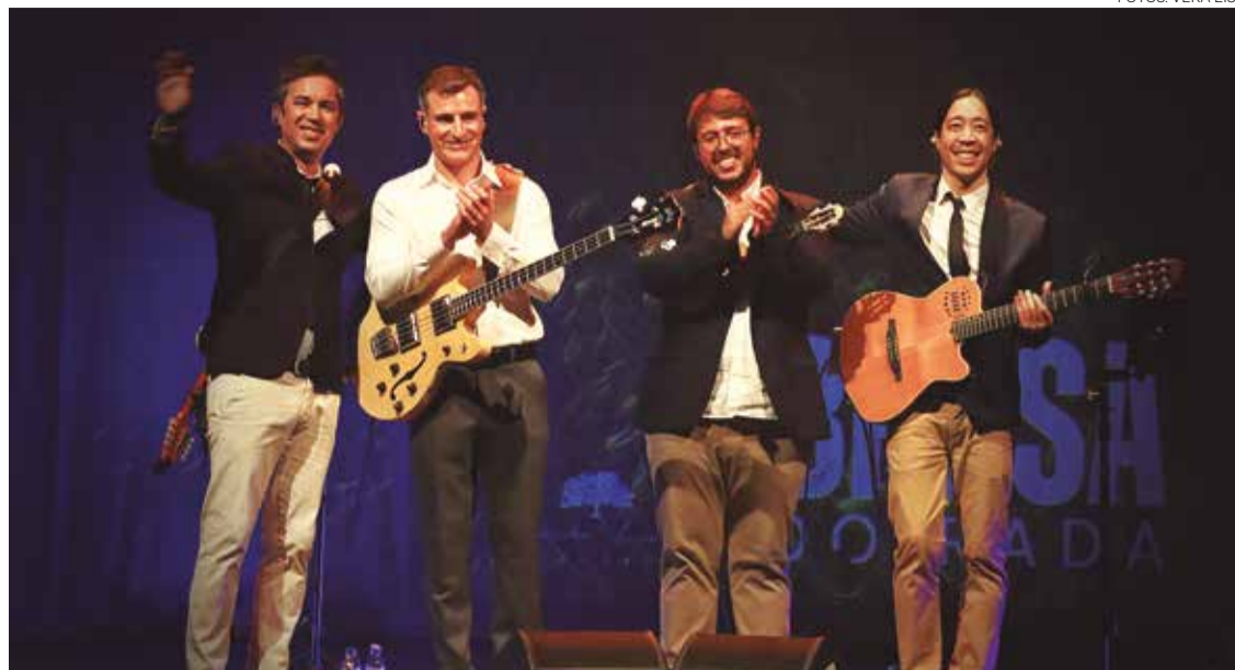
Banda celebrou dez anos de carreira em 2025

A conjugação entre o hospital e o palco é, de facto, um verdadeiro exercício de logística emocional e física. É uma profissão que exige muito de nós física, mental e emocionalmente. E a música, quando é levada a sério e feita com alma, também exige. Há dias em que saímos de um turno difícil e vamos diretos para uma atuação, e vice-versa. Não é fácil, mas vale a pena. Tudo isto só é possível graças ao apoio incondicional das nossas famílias, à compreensão dos nossos chefes de serviço e dos colegas de trabalho. As nossas esposas são verdadeiras heroínas — seguram a casa, os filhos e tantas ausências com uma força e uma generosidade indescritíveis. Sem elas, este projeto simplesmente não existia. São o nosso pilar silencioso. E aos nossos filhos, que tantas vezes adormecem sem um beijo de boa noite porque o pai está no hospital ou num palco... deixamos este mimo escrito: