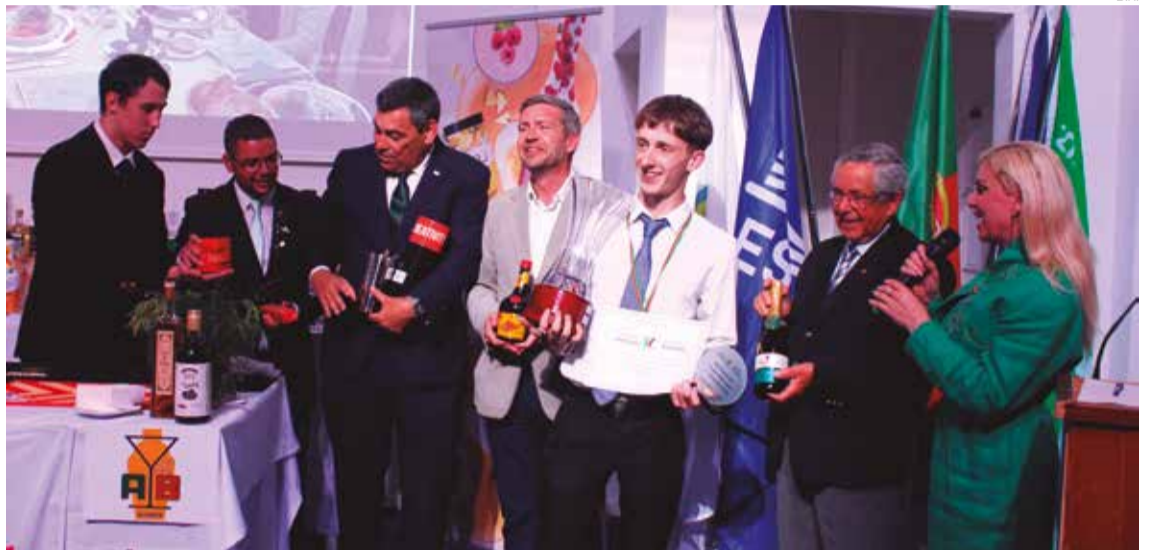
Originalidade deu mote aos cocktails a concurso

Outro objetivo foi o de reforçar a importância da formação