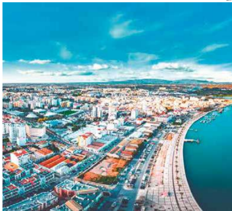
Descarbonização e adaptação climática são alguns dos temas

A elaboração do Plano, segundo descreve ainda a Câmara Municipal, foi dividida em seis fases distintas, que passaram por um ‘Guia Metodológico’, o ‘Cenário Base de Adaptação Climática’, ‘Diagnóstico para a Neutralidade