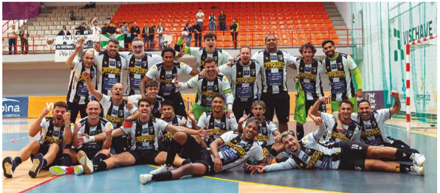
A festa merecida da equipa alvinegra no palco de todos os sonhos

O coordenador releva também o que se passou no seio do grupo, que contribuiu para este estado de graça. “Nunca passámos nada para fora, tudo foi sempre discutido e analisado dentro de portas, inclusive quando tínhamos de elogiar ou criticar. Mesmo com a boa consequência de resultados houve um claro travão à euforia. No pós-jogo todos davam opinião