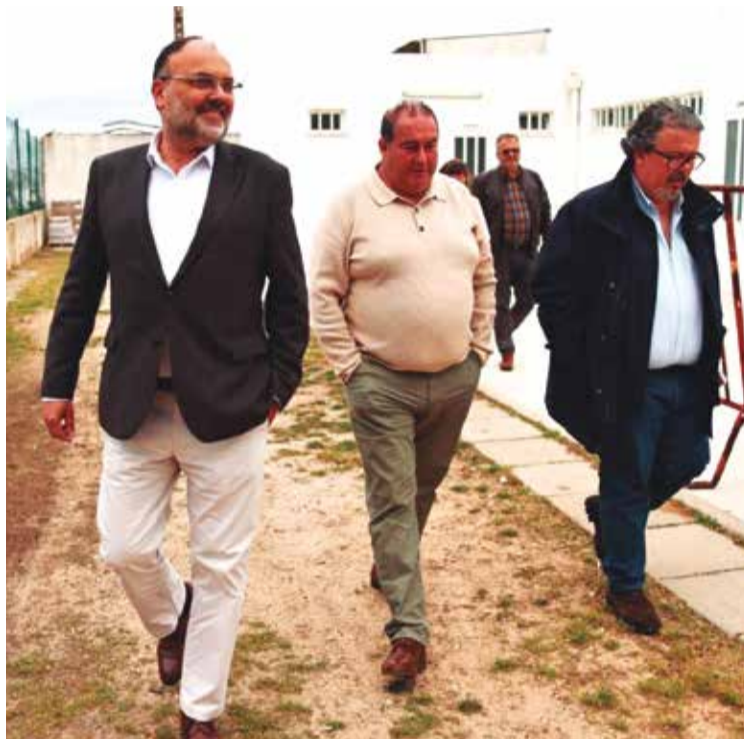
Estádio, zona ribeirinha e centro da vila foram espaços visitados

ao centro da vila, que verá entrar em funcionamento, em maio, a Zona de Acesso Controlado de Alvor. Será, numa primeira fase, um teste para aferir a organização das operações de carga e descarga na localidade. “O contacto direto com os residentes permitiu, igualmente, esclarecer dúvidas e recolher contributos relevantes para a melhoria contínua desta solução”, assegura a autarquia.