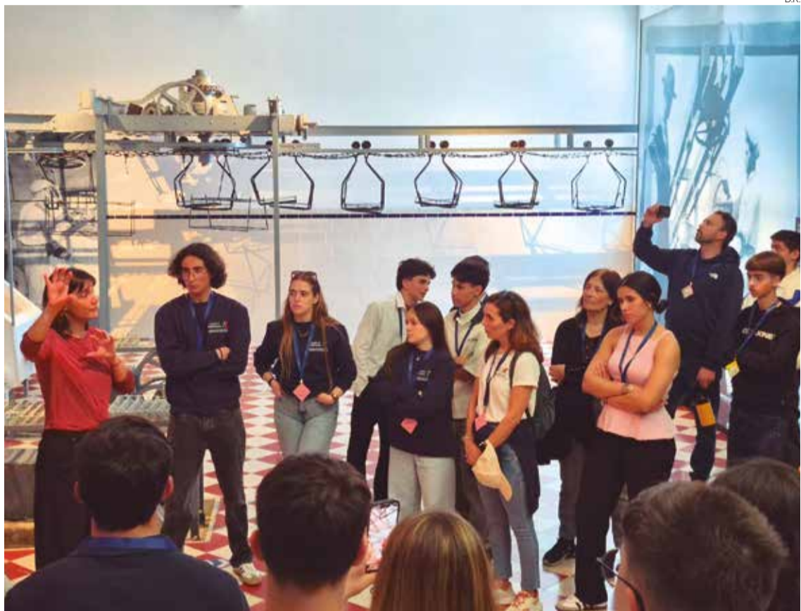
Evento focou a importância da sustentabilidade e responsabilidade ambiental

É, aliás, considerado um eixo estruturante da formação lecionada nas escolas e no seu envolvimento em vários projetos, que, tendo em conta 2025, registou um crescimento de 30 por cento face ao ano anterior. Contribuiu para formar profissionais mais cons-