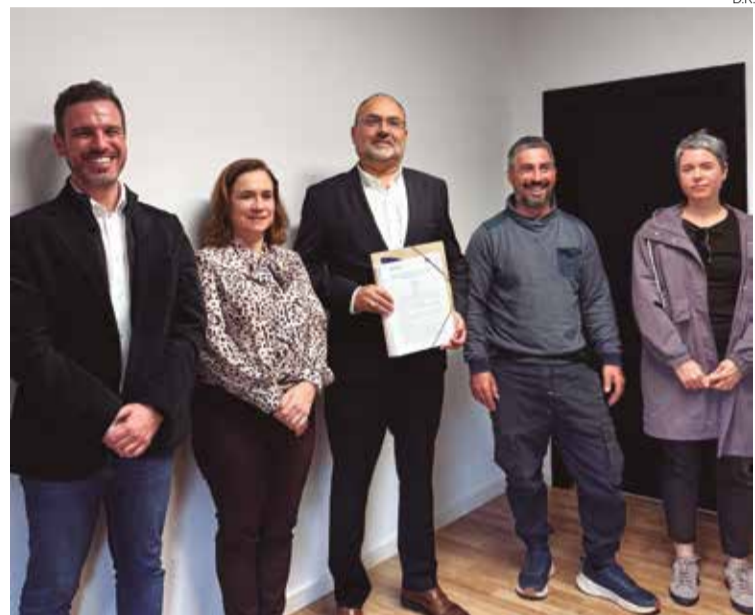
Atualização dos vencimentos é um dos destaques no acordo

“A conclusão deste processo com ambas as estruturas sindicais constitui também um passo fundamental para a consolidação de um clima de estabilidade e paz social numa empresa que assegura serviços públicos essenciais à população, de forma contínua, 24 horas por dia, 7 dias por semana”, conclui a Empresa portimonense em nota de imprensa.