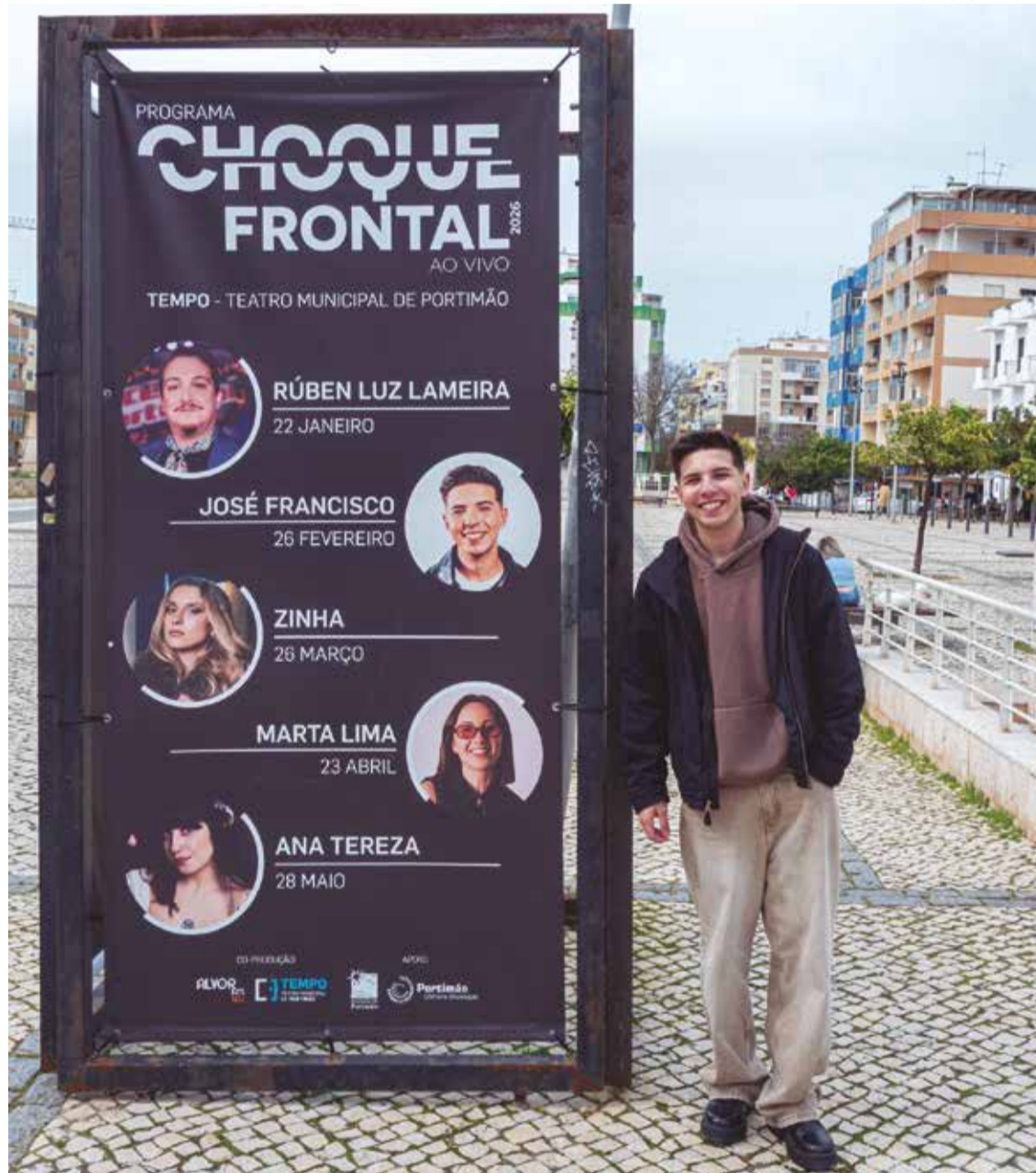
Cantor portimonense recorda as primeiras atuações nos palcos da sua cidade