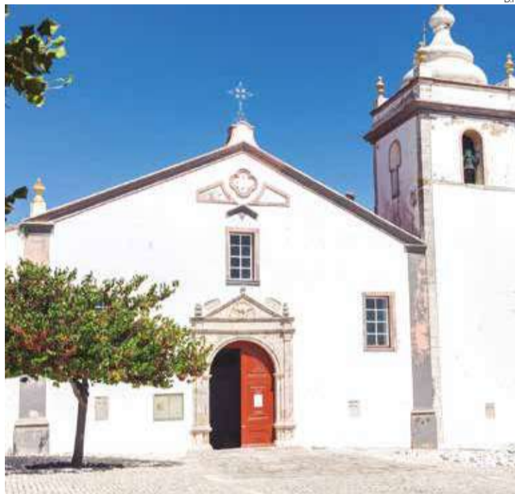
Bênção dos Ramos marca o início das celebrações

O programa encerra no Domingo de Páscoa, 5 de abril, com eucaristias na Igreja da Figueira,