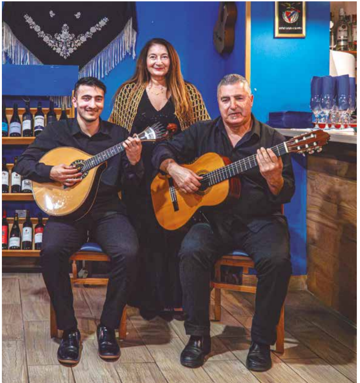
Família arriscou-se no fado e, agora, atua em diversas casas

Por essa altura, já a minha esposa atuava comigo nos hotéis, eu nas teclas e ela no canto. Fizemos essa vida até à altura da pandemia do Covid-19, embora, por essa altura, já estivéssemos também no