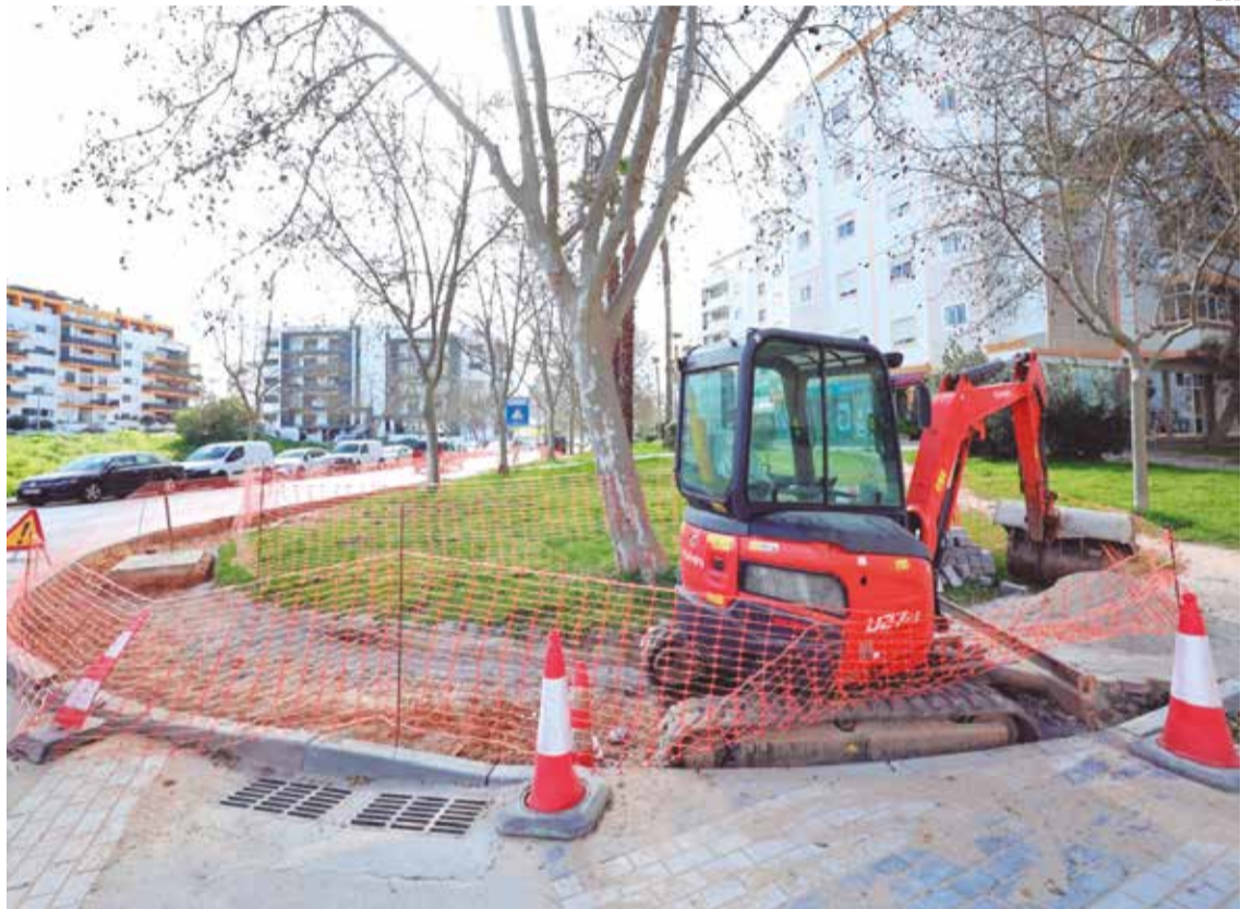
Rota acessível ganha novos percursos

Ainda relacionado com a questão da mobilidade, a autarquia