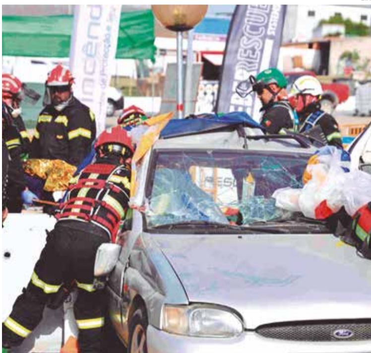
Equipas vão apurar-se em Portimão para o mundial no Brasil

Campeonatos Nacionais de Salvamento por Cordas, Desencarceramento e Trauma serão entre 21 e 24 de maio.