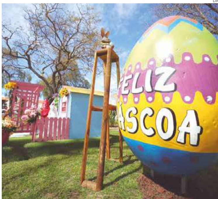
É já na próxima semana que a cidade entra nos festejos da Páscoa

A intenção é conciliar a tradição com a alegria da celebração em ambiente familiar, através de um conjunto de propostas, em que estarão também em destaque as cerimónias religiosas pascais nas várias paróquias. Já a animação é dirigida às famílias, envolvendo, num ambiente único, os residentes e turistas que estiverem de visita ao concelho neste primeiros dias de abril.