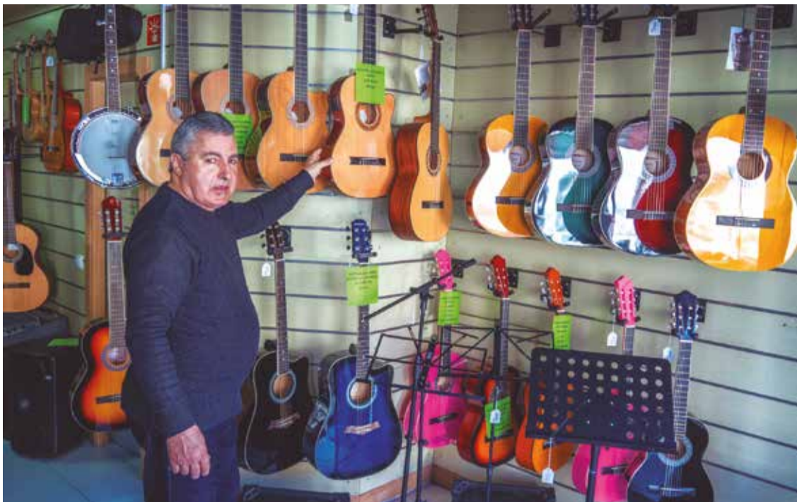
'Instromúsica' situa-se na Rua Infante D. Henrique