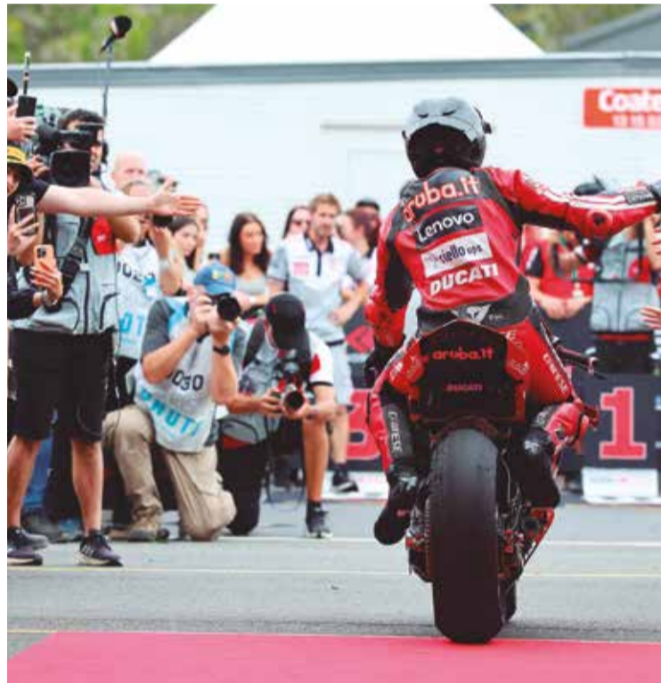
Público deverá apoiar com entusiasmo o piloto português

Serão três dias de velocidade, emoção e espetáculo, que voltam a colocar Portimão no centro do motociclismo mundial. Além das corridas, estará de volta o 'comboio turístico', nos dias 28 e 29, bem como as populares 'Hot Laps', nas quais os mais destemidos poderão percorrer o traçado guiados por um dos instrutores da 'Racing School' numa ve-