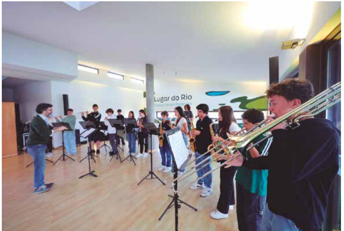
Iniciativas para todos os gostos marcam a programação do Março Jovem

Revelando-se também um sucesso, o Fusion Fest, que foi uma das grandes novidades na edição do ano passado do Março Jovem, regressa este ano nos dias 28 e 29 de março, das 10h00 às 24h00. Preenchendo o fim de semana com competições de BMX Freestyle e Skate, artes e outras demonstrações, complementadas por uma área de expositores alargada, a música é também um dos pontos fortes do evento que leva ao palco, além da final do 'Battle of the Bands | Rolando Rebelo 2026', artistas nacionais como Mundo Segundo & Sam The Kid no dia 28 de março, ou os Hybrid Theory, banda de tributo aos Linkin Park, no dia 29. Com entrada livre, a programação do Fusion Fest pode ser consultada também online (www.fusionfest.pt).