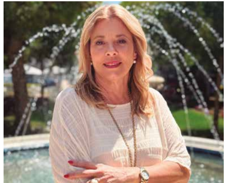
Líder congratula-se com a renovação da confiança depositada em si