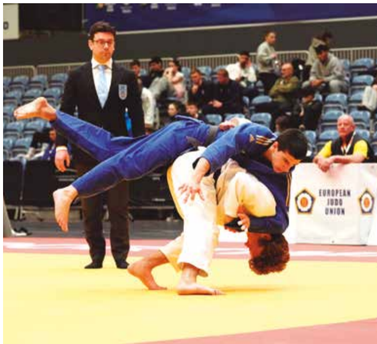
Qualidade dos atletas promete um bom espetáculo

A elevada participação reflete, ainda, as condições oferecidas, nomeadamente ao nível das infraestruturas desportivas, alojamento e capacidade da organização local. É bom lembrar que o número de visitantes rondará o milhar, uma vez que todas as comitativas integram, além dos judo-