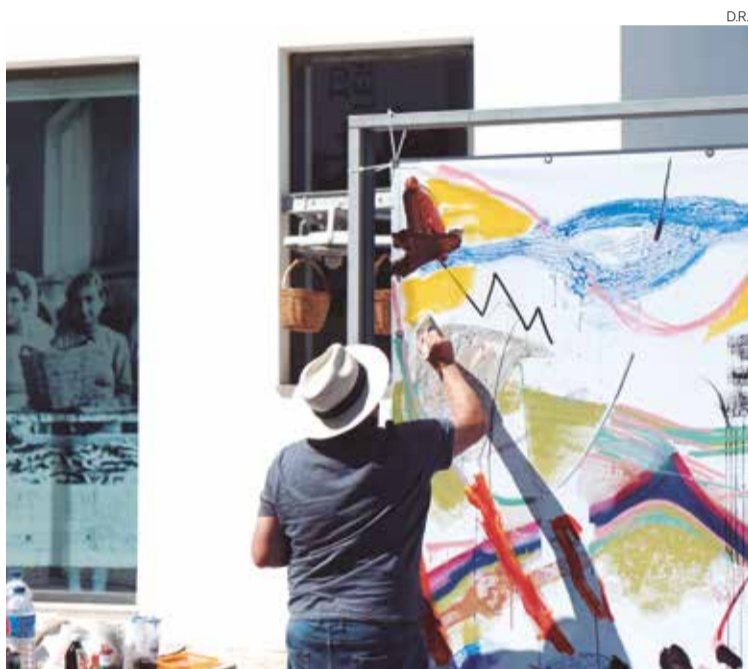
Artistas vão criar obras ao vivo