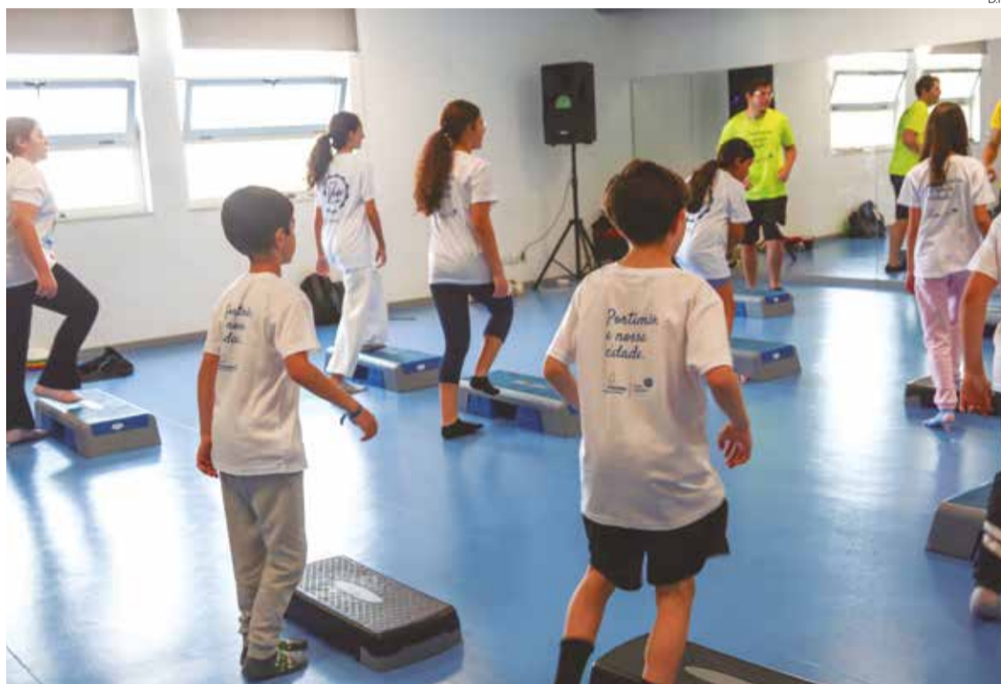
Autarquia promove programa de ocupação dos tempos livres em diversos equipamentos da cidade

Atividades decorrem entre 30 de março e 10 de abril com um conjunto de propostas desportivas, culturais e educativas.